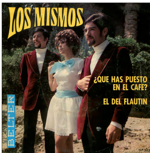
Los Mismos (24/09/1970)