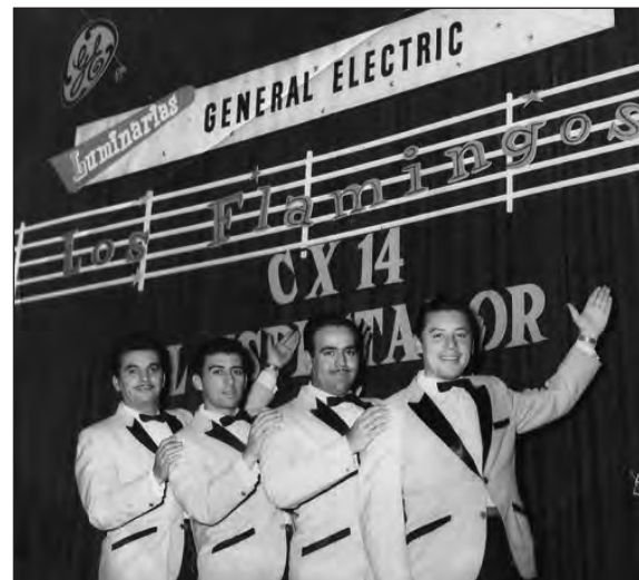
Los Flamingos (1969, 1970 y 1971)