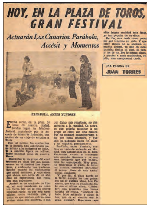
Lámina 13. Gran recital de canción moderna. Hoja del Lunes, 19-4-1971, La Verdad, 25-4-1971, Línea, 25-4-1971.