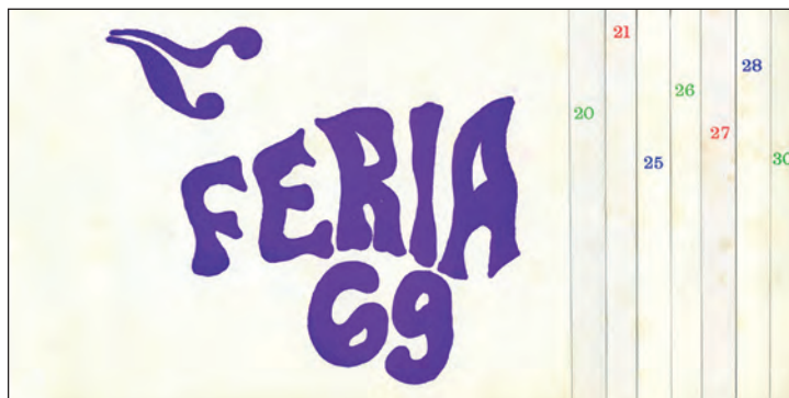
Lámina 3. Actos en el Círculo Cultural Narciso Yepes. Programa Feria 1969.