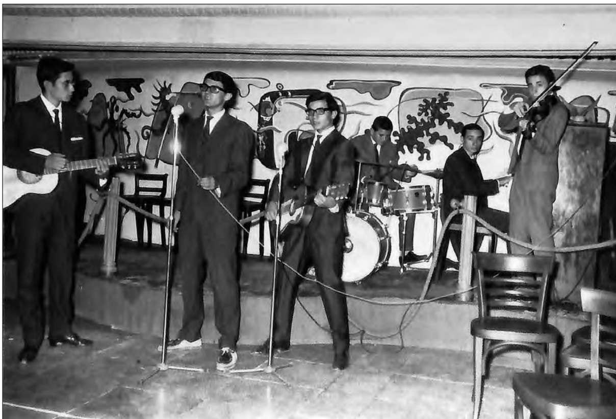
Lámina 6. Orquesta Cristal tocando en el Círculo Cultural Narciso Yepes, formada por pianista, violinista, batería, cantante y dos guitarras eléctricas.