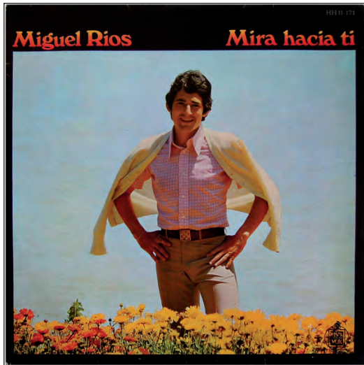
Miguel Ríos (20/09/1969)