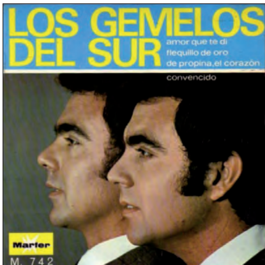
Los Gemelos del Sur (22/09/1969)