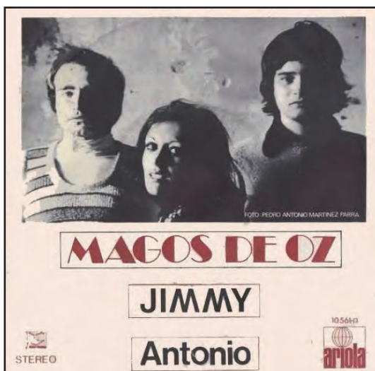
Magos de Oz (25/09/1971)