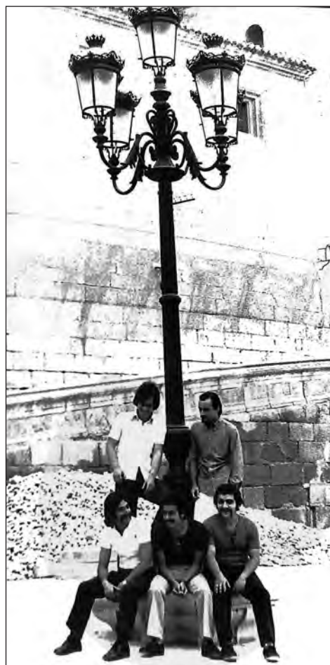
Lámina 12. Grupo Accésit en la plaza de España.

En ese tiempo el grupo participa en dos cotillones de Nochevieja en Cartagena, el primero celebrado en el Hotel Mediterráneo. Como tam-