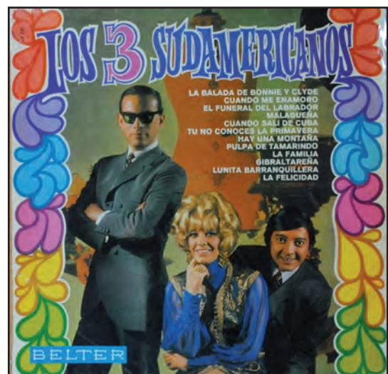
Los Tres Sudamericanos (26/09/1971)