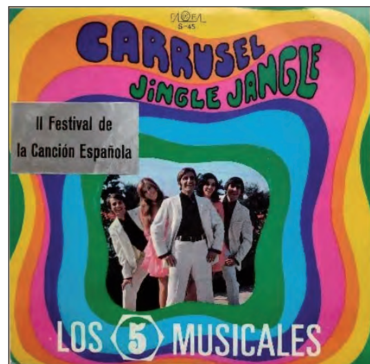
Los 5 Musicales (26/09/1970)