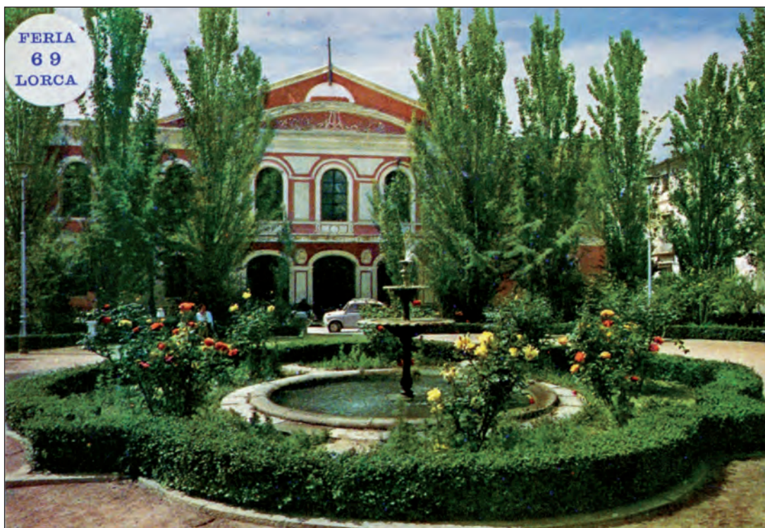
Lámina 1. Programa de la Feria de 1969.

Orquestas. Los Premiers Los Flamingos, Los 5 ibéricos, los Durán, Los Atlánticos, Los Bríos, Los Estrellas, Los Silver's, los Donals y la Orquesta Casablanca.