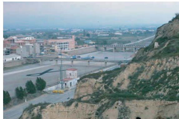
Fig. 7.- La rambla de Nogalte a su paso por Puerto Lumbreras. Sector donde se encuentra el sifón que permite el paso del agua de la Sociedad del Caño y Balsa de Puerto Lumbreras, de la margen derecha a la margen izquierda.

Proyecto de Obras del Sifón que hemos localizado en el Archivo de la Confederación Hidrográfica del Segura, en Santomera (Legajos 152 y 129 del año 1937), del ingeniero Don Fernando Susín Hernández, en cuya Memoria dice: “A través de la Rambla de Nogalte a su paso por Puerto Lumbreras, existe un cauce de tierra para el paso de las aguas destinadas al riego desde la margen derecha a la izquierda. En este cruce de la rambla se pierden o producen grandes pérdidas por filtraciones debido a la constitución permeable de terreno de dicha rambla. Con objeto de impedir estas pérdidas proyectamos la construcción de un sifón que sustituya el cruce actual. La tubería del sifón se alojará en una zanja de una profundidad mínima de dos metros y 88,60 metros de larga, con objeto de evitar que los arrastres producidos por las frecuentes avenidas puedan ocasionar daños en la tubería del sifón. Con un presupuesto de 13.271,36 pesetas. Murcia, a 17 de abril de 1937”.