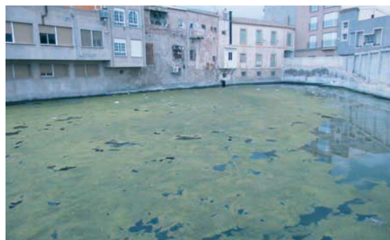
Fig. 5.- Balsa donde se acumulan las aguas alumbradas por las galerías filtrantes de Puerto Lumbreras.

En este plano tiene una especial representación la balsa en la margen derecha conocida como de Guevara, en el camino que une a la ciudad de Lorca con Huércal y otros, y dibujada frente a la iglesia. En esta balsa se recogían las aguas sobrantes del caño-abrevadero o del pozo-fuente de Lumbreras; señalada con el número 3 en el paño, y donde se acumularían las aguas alumbradas por las galerías.