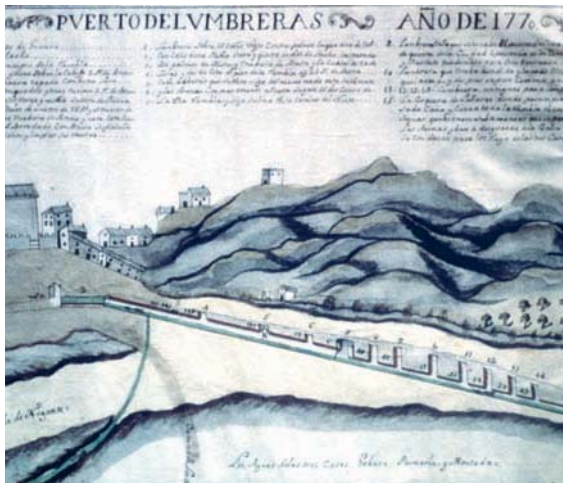
Fig. 6.- Puerto Lumbreras 1770. El agua de las tres casas: Guevara, Puxmarín y Moncada.

En la documentación del pleito aparece el tema de hacer rafas en la rambla y concretamente la que permitía pasar el agua del Caño de la margen derecha a la izquierda, llamada en el pleito “la traviesa”, quizás por un simple canal de tierra, que con posterioridad se tendría que entubar, y construir un sifón para favorecer el paso sin que hubiese pérdidas, como hemos encontrado en 1937.