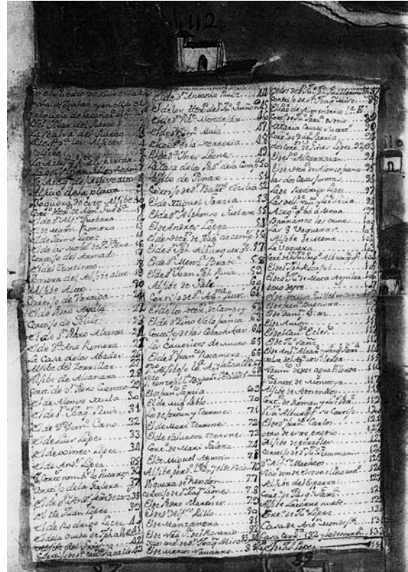
Fig 3.- Relación de aprovechamientos que aparecen en el paño pintado con la numeración correspondiente.

por lo que pudo ser solicitado el encargo por Don Alphonso Joachin Guevara o por Don Joseph Tomas Rocaful para el dicho pleito que mantenían con Lorca.