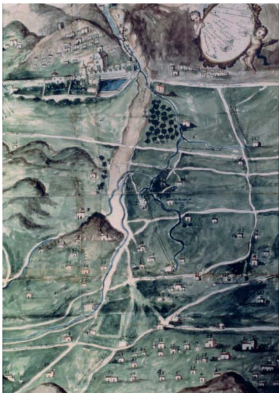
Fig. 4.- Detalles del plano pintado por Antonio Joseph Rebolloso.

El paño pintado del Fondo Espín permite observar el efecto del derrame o más bien desparraime de Nogalte y Vilerda en la Depresión Prelitoral.